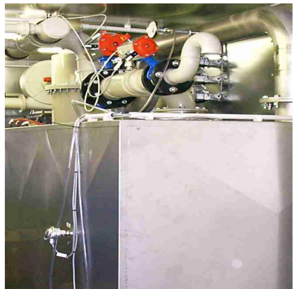
Abbildung 3: Ausschnitt DELTA KAT 500, VW Hannover

Da in einigen Fällen die zu behandelnden Konzentrationen im explosionsfähigen Bereich liegen, sind auf den Anwendungsfall abgestimmte Ex-Schutz-Maßnahmen vorzusehen.